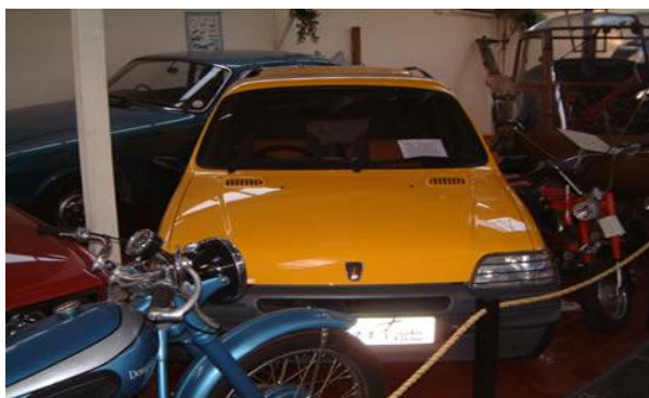
1990 ROVER SCOUT, Registration Number:H539 NOA Engine Capacity:1396cc

I dag befinder det eneste producerede eksemplar sig på Lower Stondon Transport Museum i Bedfordshire, England.